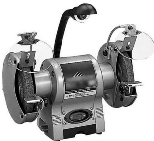
卓上用電気グラインダ