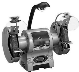
卓上用電気グラインダ