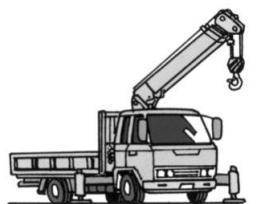
積載形トラッククレーン

本講習は「人材開発支援助成金 建設労働者技能実習コース」の対象になります。申請に必要な書類・証明等及び受験結果の問い合わせは(公社)北海道労働基準協会連合会にお願いいたします。 TEL 011-747-6141